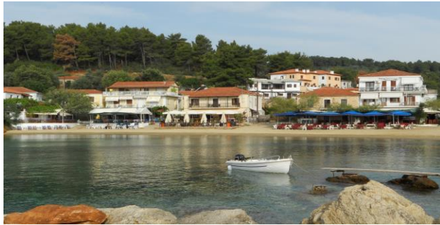
Das Dorf Katigiorgis