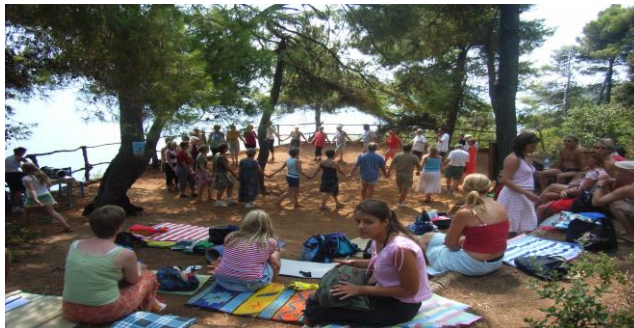
Unser Tanzplatz: hier schenkt uns das Tanzen Freude und Energie