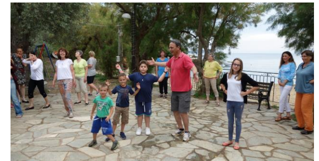
2. Tanzplatz: Die Seminar-Teilnehmer tanzen zusammen mit den Dorfkindern von Katigiorgis, im Hintergrund das Meer