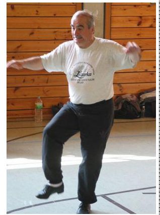
F Foto: Herwig Milde

von und mit Belco Stanev am 28./29. April 2012